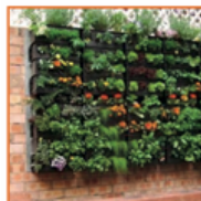
Maak je gevel groen