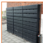
Plaats een regenton/ regenschutting