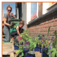
Maak een geveltuintje