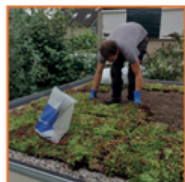
Leg een groendakje aan