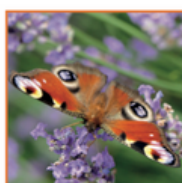
Plant een vlinderstruik