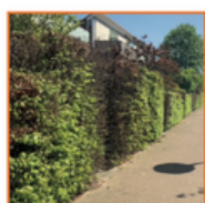
Vervang je schutting door een groene haag