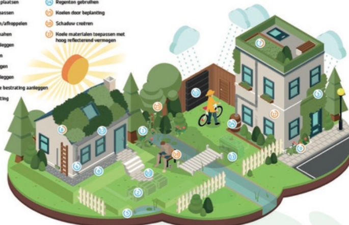
Infographic Klimaat Actie! van waterschap Drents Overijsselse Delta

Steden en dorpen schuilen niet voor regen of zon