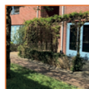
Plaats een pergola en laat deze begroeien