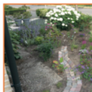
Zaag je regenpijp af en leidt water naar de planten