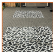
Leg waterdoorlatende stenen in je tuin