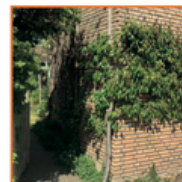
Plant een (lei)boompje